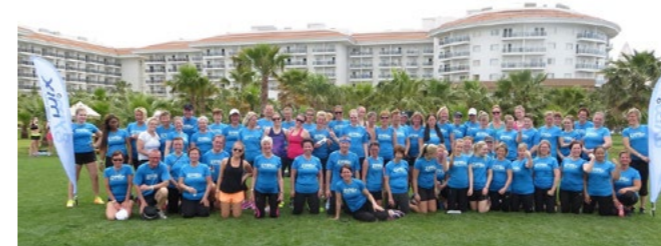
Gymmik i region öst på träningsresa i Turkiet.

Vid träningsresan till Turkiet i maj följde 70 personer med, det var en bra blandning av ledare, motionärer från olika föreningar och några medföljande familjemedlemmar. På resan fanns de representation från sex föreningar, de flesta inom regionen men också ett par stycken från vår närliggande region Mellansvenska. Resan var mycket lyckad och innehöll cirka 30 gruppträningspass av olika slag, medlemsträffar, ledarmöten, god mat, härlig sol och lite regn.