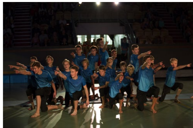
Stockholm Mass Squad - regional pojkmassstrupp

Masstruppen medverkade även efter EUROGYM 2014 på regionens uppvisningsevenemang, Stockholm Gymnastics Show.