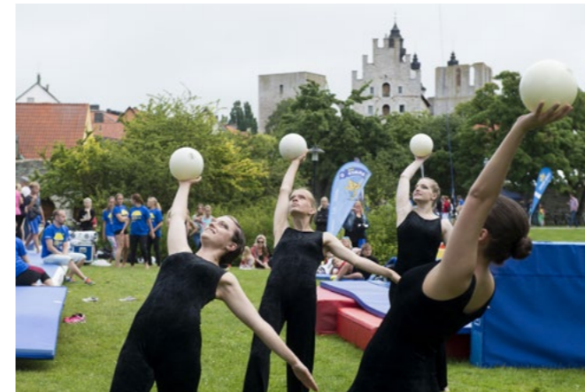
Uppvisningsgymnastik stod på programmet i Almedalen

Idrottens dag är ett årligen återkommande evenemang på Gotland, som arrangeras av Riksidrottsförbundet och anslutna SF under Almedalsveckan. Dagen syftar till att visa upp idrotter i samband med att landets politiker huserar i Visby, vilket skapar en möjlighet att visa vilka frågor som är viktiga för oss inom gymnastiken och hur våra politiker kan bistå med att underlätta och förbättra förutsättningarna för vårt utövande.