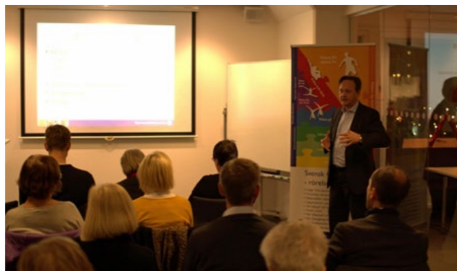
Ordförandeträffar har anordnats för att diskutera aktuella frågor, utveckling och Vision 2020 tillsammans med ordföranden i regionen.

Vi ser dessa föreningsträffar som väldigt värdefulla och har för avsikt att fortsätta dessa satsningar även kommande år.