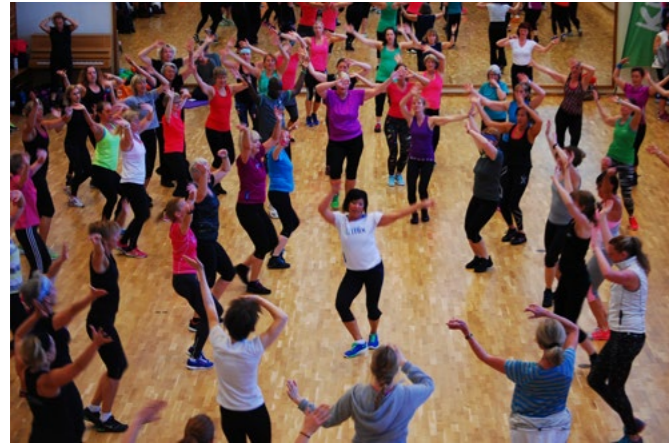
2014 års Gymmix & Korpen Inspirationskonvent på Gymnastik och Idrottshögskolan.

Söndagen den 27 april anordnades återigen vårt årliga gruppträningskonvent Gymmix och Korpen Inspirationskonvent på Gymnastik och Idrottshögskolan i Stockholm (GIH),