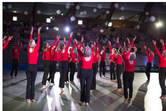
IDLA-flickorna uppträder på Stockholm Gymnastics Show

Arrangemanget lockade över 500 besökare till Eriksdalshallen söndagen den 14 september, där Gymnastikförbundet Öst tillsammans med flertalet regionala föreningar visade upp det bästa gymnastiken har att erbjuda. Flertalet discipliner som finns i regionen fanns representerade på denna uppvisning.