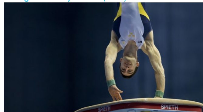
Manlig Artistisk gymnastik

Den regionala kommittén för manlig artistisk gymnastik (MTK Öst) har under året arbetat med att bearbeta frågan hur de kan stimulera breddverksamheten, samt bibehålla gymnasterna uppåt i åldrarna. Vidare har MTK Öst diskuterat och verkat för en tävlingsklass avsedd för breddverksamheten.