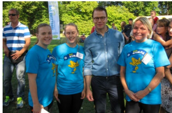
Idrottens dag i Hagaparken

I september genomfördes Idrottens dag i Hagaparken likt föregående år. Många glada barn fick prova på Bamsegymna och våra ledare hade fullt upp med att ta hand om alla gymnastikintresserade barn. Även Prins Daniel uppmärksammade också Bamsegymnan och tittade förbi på ett besök.