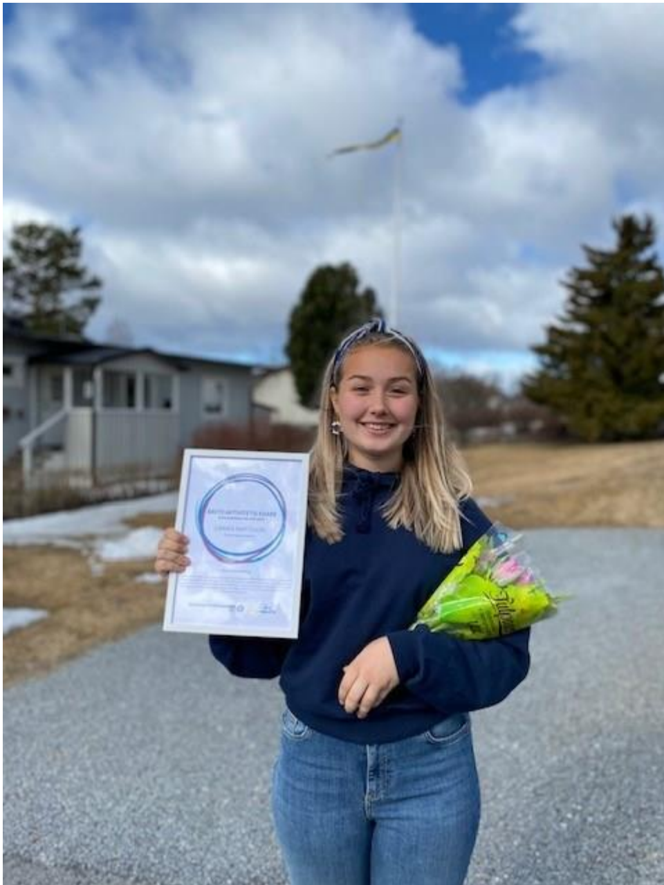
Årets Förening Sollefteå Gymnastikklubb