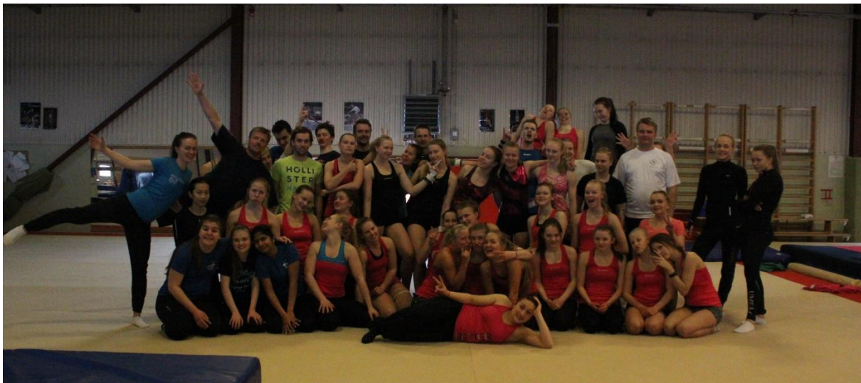
Gruppen från 15plus-lägret.