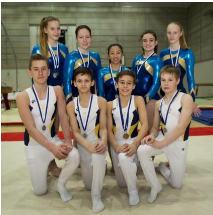
De svenska Barentslagen dam och herr i Uleåborg, Finland.