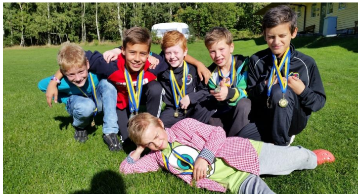
Gymnaster från norr på Svenska Cupen.

3-4/10 gick KirunaCupen av stapeln med deltagare från Kiruna och Luleå. Det blev inte så många deltagare den här gången men de som var där var nöjda och glada.