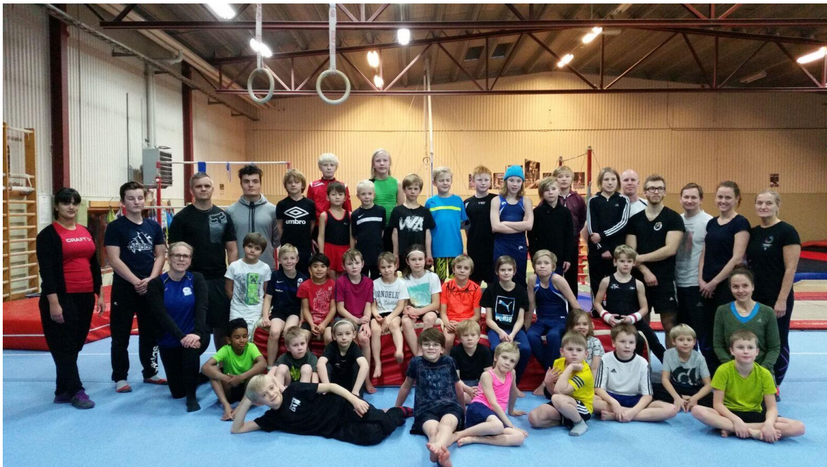
Gruppbild från Utvecklingsgruppslägret 2-4/12.