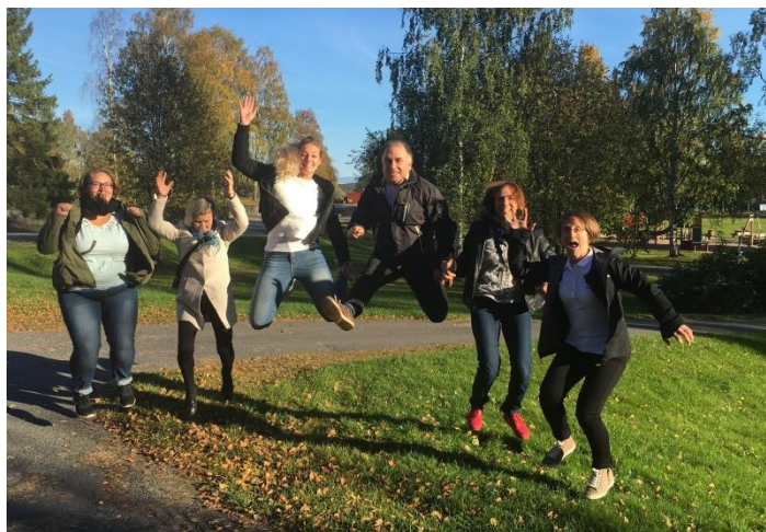
Regionstyrelsen i samband med planeringskonferensen i Boden.

Planeringskonferensen 16–17 september i Boden samlade större delen av styrelsen och representanter från alla kommittéer. Vi startade upp på fredagskvällen med kommittétid och för styrelsen en träff med Calle Pakkala från Norrbottens Idrottsförbund med fokus på jämställdhetsarbete. På lördagen påbörjades arbetet med Verksamhetsplan för 2017 och en årsplan med läger, tävlingar, utbildningar och övriga arrangemang sammanställdes. Dagen avslutades med styrelsemöte.