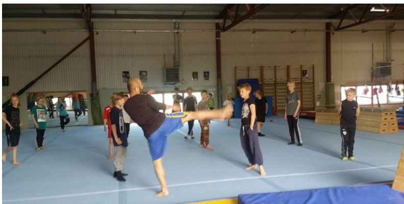
Prova-på PKTR i Luleå den 28/5.

Under tre dagar i maj månad arrangerades tricking/parkourdag i Luleå och Holmsund. Det startade på fredagskvällen på Voltarenan med jam/gathering för såväl nybörjare som avancerade deltagare. Lördagen fortsatte med en ”prova-på-dag” för intresserade i Voltarenan och en liknande dag arrangerades sedan på söndagen i Storsjöhallen i Holmsund.