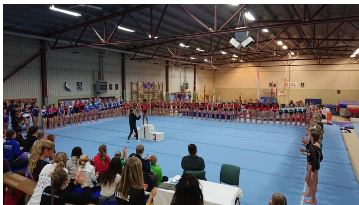
Foto: Prisutdelning, Kristallcupen i Luleå

Under året har det anordnats sju stycken stegserietävlingar från Umeå i söder till Kiruna i norr. Totalt har det startat 845 gymnaster på dessa