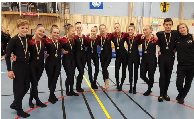
Lulegymnasterna vann Truppslaget i Holmsund.