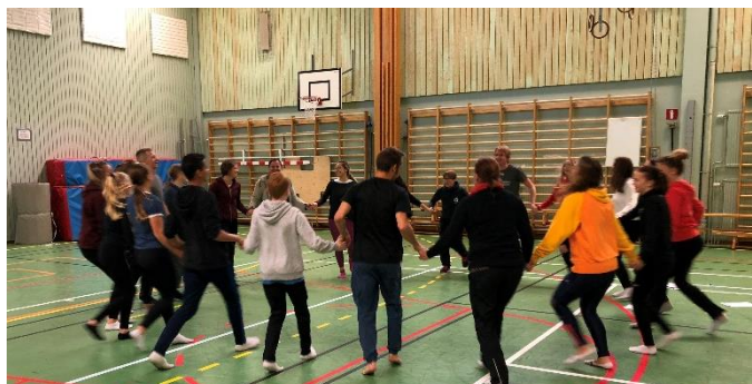
Bild från en av årets rekordmånga baskurser.

Baskurs barn och ungdom går mycket bra med många deltagare. Under året har vi genomfört hela sju baskurser i regionen på orterna Umeå (3 st), Boden, Kiruna, Skellefteå och Arvidsjaur. Totalt utbildades ca 120 nya ledare genom dessa baskurser vilket känns väldigt roligt och dessutom är rekordmånga för regionen.