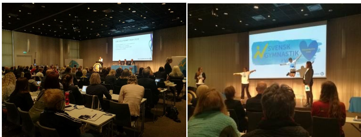
Foto: Bilder från Förbundsmötet i Malmö.