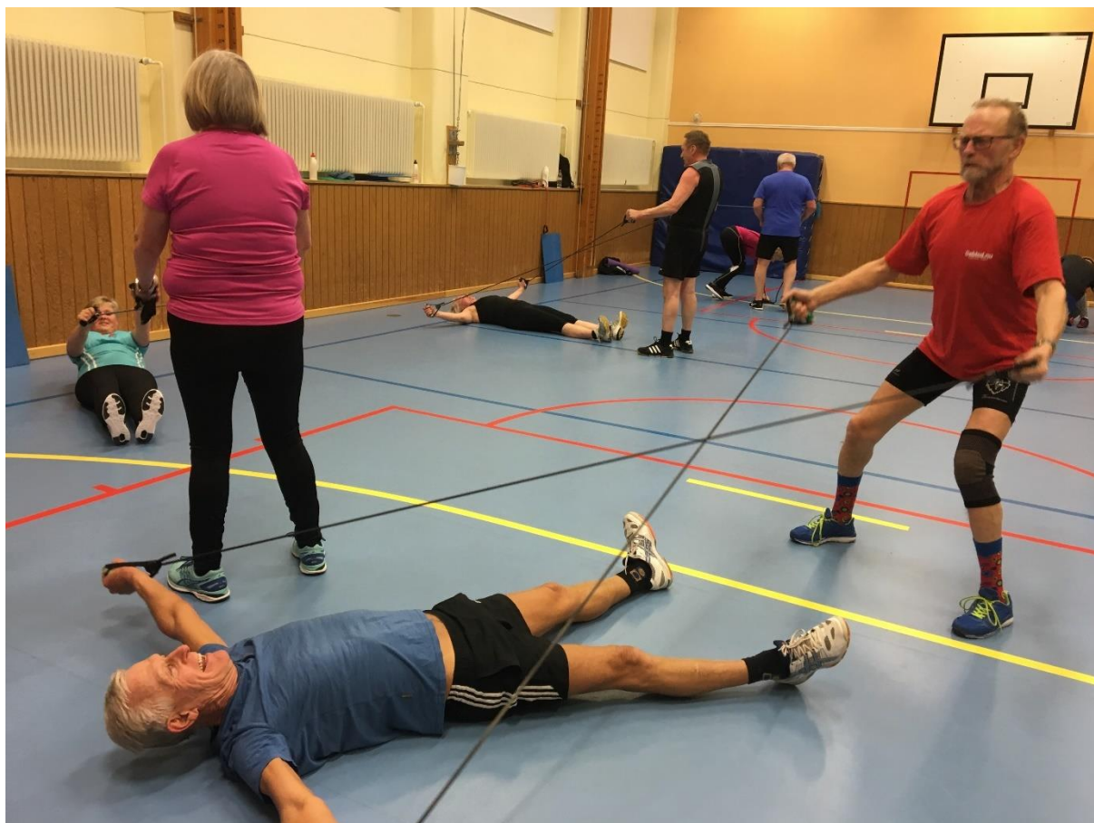
Gummibandsträning med Umeå GF på Grisbackaskolan i Umeå.

Glädjande är att Gymnastikförbundet nationellt har inlett ett samarbete med Korpen och PRO som handlar om att man gemensamt ska ta fram ett antal nya träningsprogram för seniorer. För att nå många deltagare tror vi på samverkan med fler organisationer och ser detta samarbete som en fin möjlighet till det.