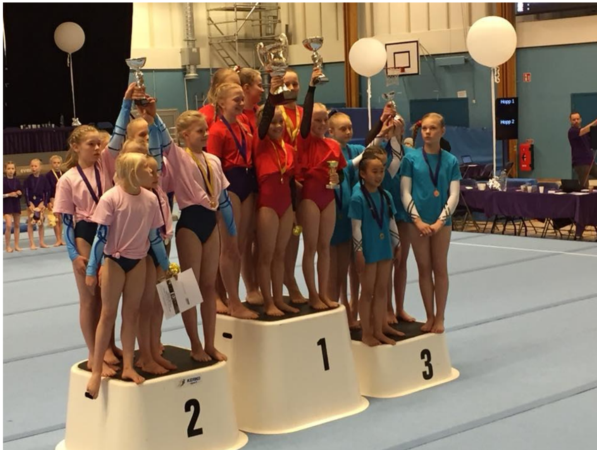
Foto: Prisutdelning, Riksfinalen i Stockholm

knep silvermedaljen i steg 6. Det var kul med en tävling som omfattade gymnaster från alla regioner i Sverige då gymnasterna fick tävla mot andra tjejer än de brukar tävla mot. Det är lärorikt att få åka på tävlingar som man inte brukar åka på så ofta och få träffa andra gymnaster och ledare.